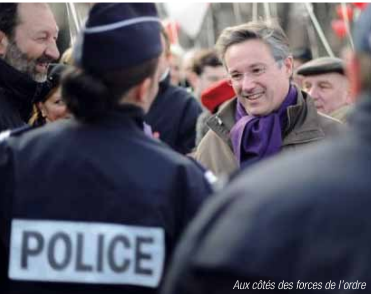
Aux côtés des forces de l'ordre

« Dans les médias, le gouvernement tient un discours de fermeté. Mais les actes ne suivent pas. »