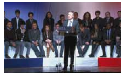
Nicolas Dupont-Aignan à la tribune pour sa déclaration de candidature

Sur la scène nationale, Nicolas Dupont-Aignan s'est engagé très tôt auprès de Philippe Séguin au moment du référendum sur le traité de Maastricht. La volonté de rendre à la France la maîtrise de son destin fut le fil conducteur de son engagement politique. Elu député dès 1997 il a, avant tous les autres comme Philippe Séguin et Philippe de Villiers , mis en garde contre les dérives d'une certaine construction européenne. Le référendum de 2005 et sa campagne courageuse pour le Non ont été l'occasion pour lui de se faire connaître du grand public.