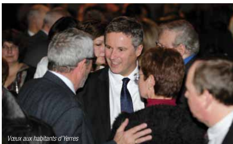
Vœux aux habitants d'Yerres

Maire de banlieue confronté aux méfaits d'une minorité de petits voyous, il est le 1 er maire à avoir supprimé les aides municipales pour les familles de mineurs délinquants.