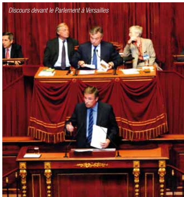
Discours devant le Parlement à Versailles

En 2008 au moment de la ratification du traité de Lisbonne, Nicolas Dupont-Aignan fait partie des quelques parlementaires qui refusent de trahir le peuple, et vote contre ce texte.