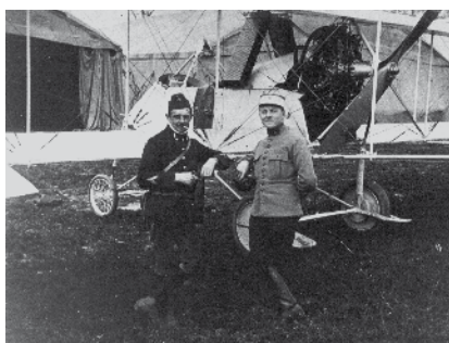
Un grand-père aviateur héros de la guerre 14-18

Son grand-père a été un des premiers aviateurs lors de la Grande Guerre. Son père, chasseur-alpin, fut fait prisonnier et s'est évadé pendant la seconde guerre mondiale. C'est cet héritage qui a fait naître chez lui une certaine idée de la France.