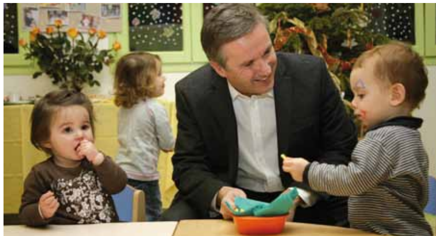
Dans la crèche Les Calinoux à Yerres

Afin de responsabiliser les enfants, Nicolas Dupont-Aignan a demandé aux élèves de passer le balai dans la classe à la fin de chaque journée d'école.