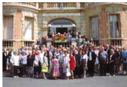
Nicolas Dupont-Aignan devant la mairie pour les noces d'or d'un couple de Yerrois

Dans sa ville d'Yerres il accomplit un travail remarquable et sa réélection au premier tour en