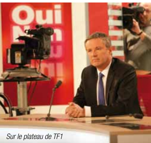
Sur le plateau de TF1

Après avoir redressé avec succès sa ville d'Yerres, Nicolas Dupont-Aignan devient en 1997 un des plus jeunes députés de l'Assemblée nationale. Il est d'ailleurs le seul à faire basculer une circonscription de gauche à droite.