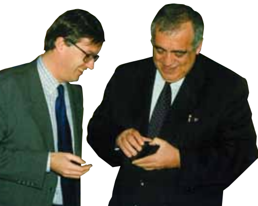
Remise de la médaille de la ville d'Yerres

A l'occasion du référendum sur le traité de Maastricht, Nicolas Dupont-Aignan s'engage aux côtés de Philippe Séguin et Charles Pasqua pour le Non. Il mène une campagne sur le terrain pour convaincre les Français que l'Euro est une très mauvaise affaire pour la France, et que ce traité dévoie la belle idée européenne pour en faire l'instrument de quelques technocrates non élus.